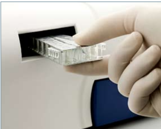
Con el analizador AQT90 FLEX puede disponer de hasta 16 tests por cartucho.