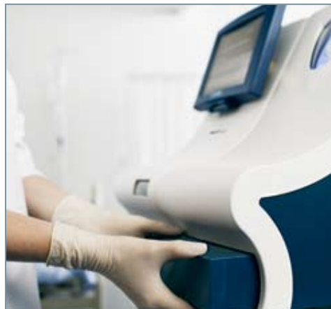
Sistema de desechos sencillo y seguro.